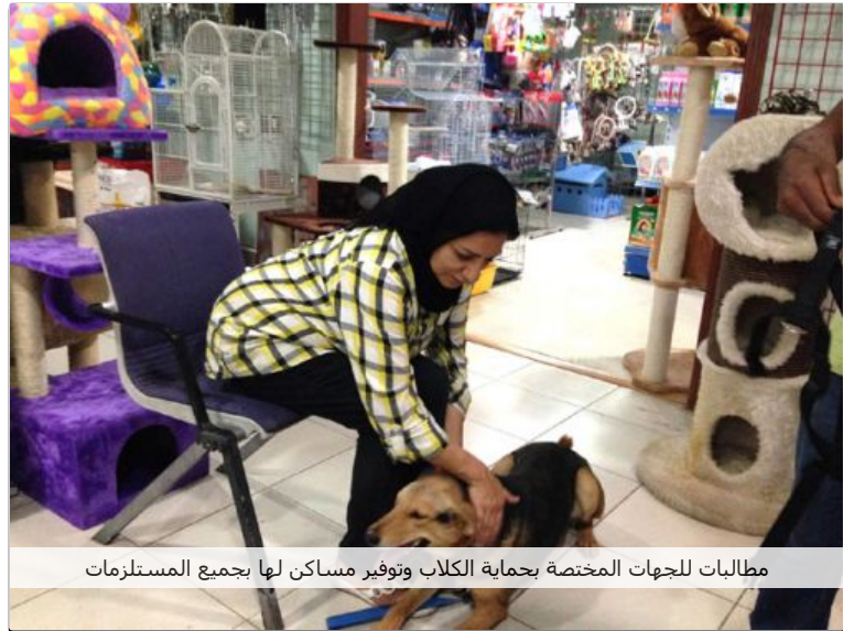
مطالبات للجهات المختصة بحماية الكلاب وتوفير مساكن لها بجميع المستلزمات